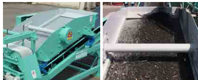
スクリーン サイズ選別