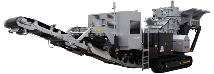
電動自走式インパクトクラッシャ

また、部品交換の容易さ、耐摩耗性の部品取付などメンテナンス性を考慮しています。投入原料は選ばず、リサイクルでは比較的小さな原料を一次・二次破碎の両用機として、碎石では破碎・整粒機として利用され、生産性・操作性・耐久性に優れています。