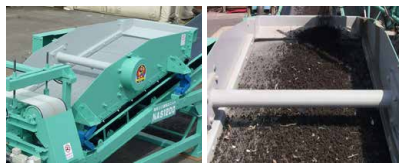
スクリーン サイズ選別