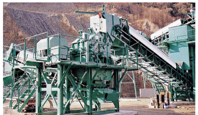
二次破碎・整粒機