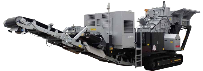
電動自走式インパクトクラッシャ

また、部品交換の容易さ、耐摩耗性の部品取付などメンテナンス性を考慮しています。投入原料は選ばず、リサイクルでは比較的小さな原料を一次・二次破碎の両用機として、碎石では破碎・整粒機として利用され、生産性・操作性・耐久性に優れています。