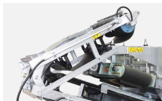
折りたたみ式メインベルトコンベヤ