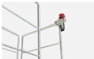
過負荷停止外部表示灯