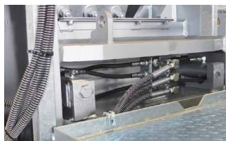
ワンタッチセット調整システム