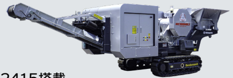
AC2415搭載 電動自走式クラッシャ NE100HBJ