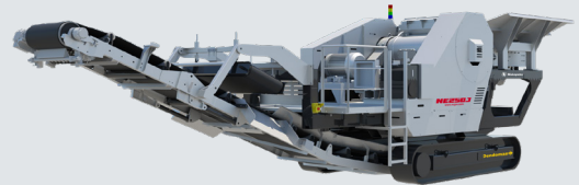
AC4220BH搭載 電動自走式クラッシャ NE250J